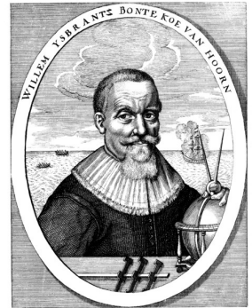
Willem Ysbrantz Bontekoe