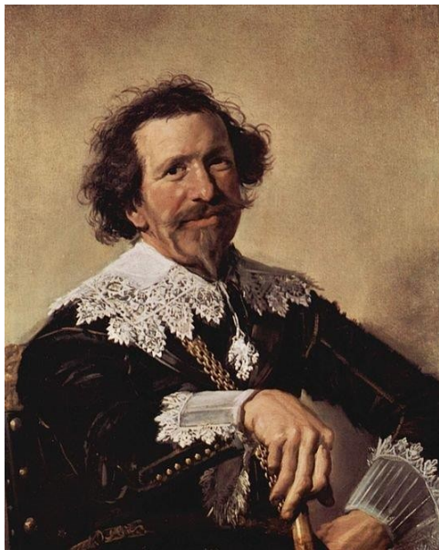
Pieter Van den Broecke door Frans Hals C. 1633—Kenwood House, London

Er was eens, heel heel lang geleden, bij onze bloedeigen Antwerpse VOC ... jawel : een lidkaart ! Wie in de beginjaren van onze vereniging braaf zijn 25 € bijdrage betaalde, kreeg door het bestuur enigszins plechtig een artistiek bedrukt blauw kaartje uitgereikt, dat door de betrokkene niet zelden met een krop in de keel in ontvangst werd genomen. Dit lidkaartje verplichtte niemand tot iets, maar bij vrienden en kennissen wees het bezit ervan toch duidelijk op een hoger intellectueel peil ! Papierbesparing, minder gebruik van drukinkten, rentedalingen, computercrashes, tekort aan personeel en wie weet welke andere duistere redenen nog allemaal, maakten echter dat het VOC-lidmaatschapsbewijs na verloop van tijd niet meer werd uitgereikt. Later toegetreden leden betaalden gewoon hun 25 €, maar kregen er geen artistiek aandenken meer voor in de plaats en de plechtige overhandiging en bijhorende roerselen verdwenen daardoor totaal uit onze Antwerpse VOC-biotop. Over het artistieke blauwe VOC-lidkaartje viel voor jaren het doek der vergetelheid, zoals dat trouwens ook al eeuwen is gevallen over de afgebeelde Antwerpenaar Pieter Van den Broecke!