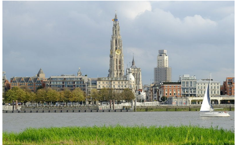
De Onze-Lieve-Vrouwekerk en de Boerentoren, gezien vanaf de linker Scheldeoever