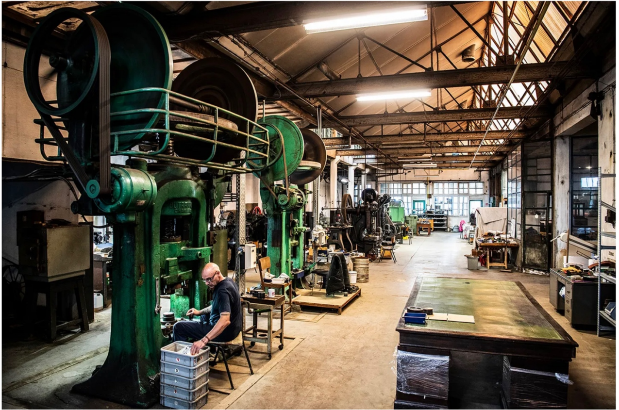
In het grote atelier werkt Marc Van Hulle nog een laatste bestelling af aan de grote pers.