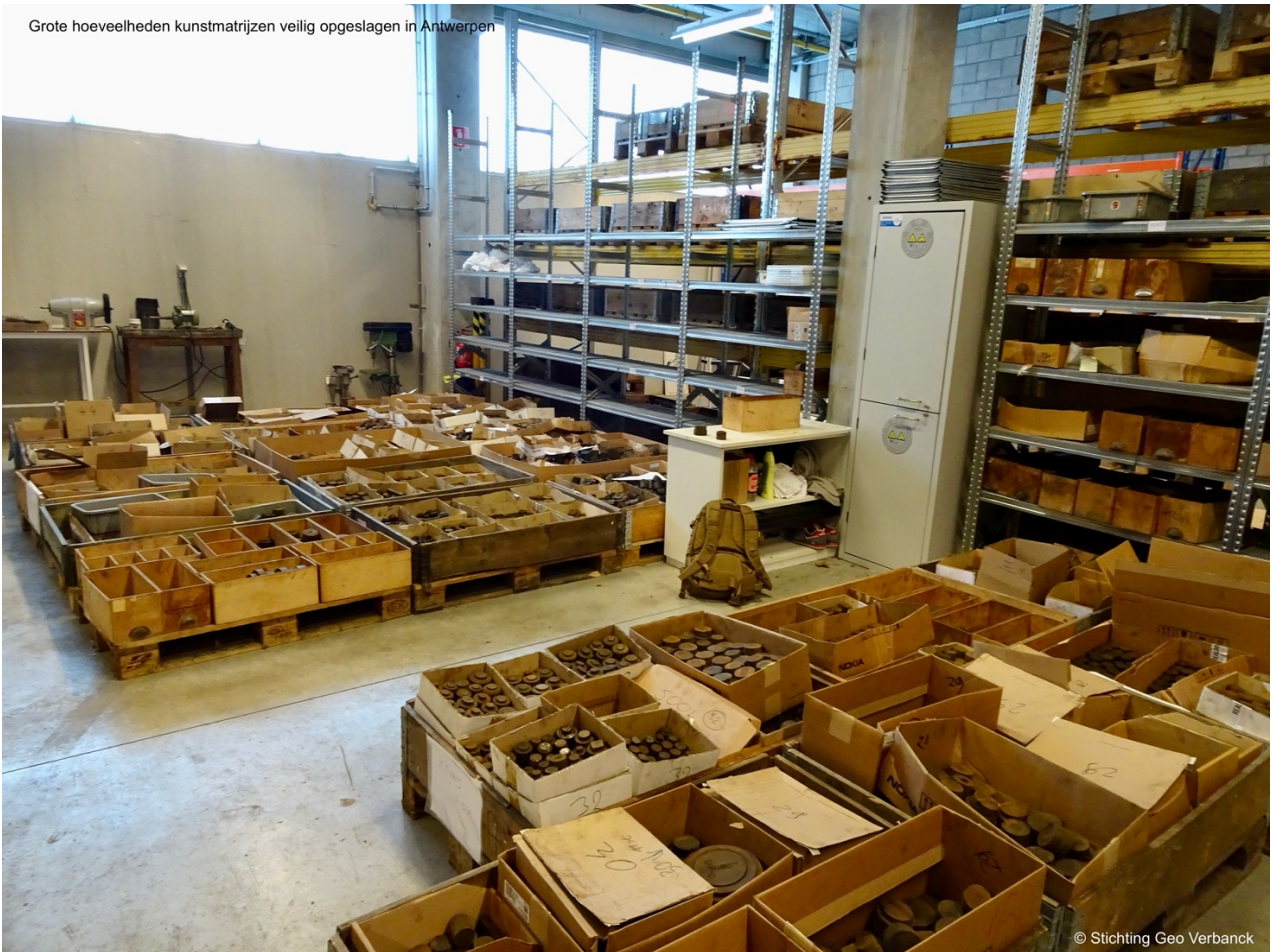
Grote hoeveelheden kunstmatrijzen veilig opgeslagen in Antwerpen