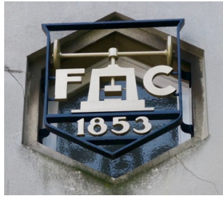
logo van de gebroeders Fisch

Medaille atelier Fonson was ooit een bijzonder welvarende onderneming. Gesticht in 1827 door Jean-François Fonson, werden er duizenden kunstmedailles geslagen in brons, zilver en goud.